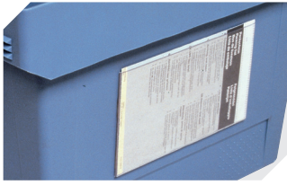
Etikettentaschen selbstklebend 3 Seiten offen L 175 x B 105 mm 6-5031