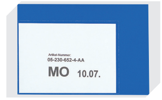
Etikettentaschen selbstklebend 2 Seiten offen L 145 x B 100 mm 46-21108