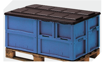
Coiffes pour conteneurs palettisés | 1220 x | 820 mm 9-18421