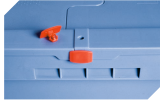
Scellés de sécurité MBP2 - pour la BITOBOX MB 6-15705