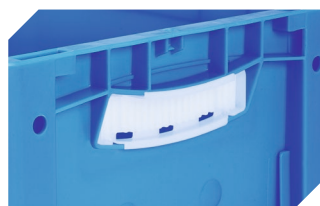
Obtrateurs pour poignées ouvertes pour bacs gerbables norme Europe, série XL d'une hauteur de 170, 220 et 270 mm 43-31450