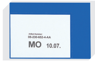
Etikettentaschen selbstklebend 2 Seiten offen L 145 x B 100 mm 46-21108