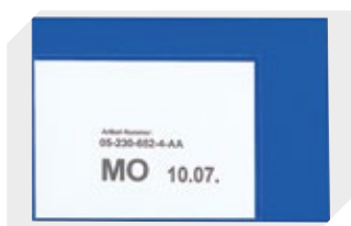
Etikettentaschen selbstklebend 2 Seiten offen L 145 x B 100 mm 46-21108