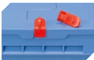
Verschluss-Clips für BITOBOX MB 6-20299