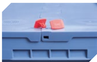
Plomben MBP2-L - für BITOBOX MB, XL, SL 6-19162