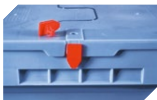
Plomben MBP1 - für BITOBOX MB 6-10810