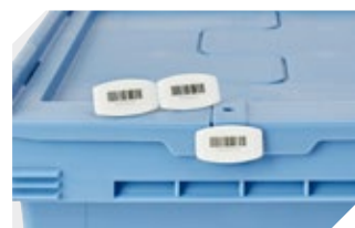
Barcode-Plomben MBP3 - für alle Mehrwegbehälter MB-Größen und XL-Behälter 800 x 600 mm 6-31550