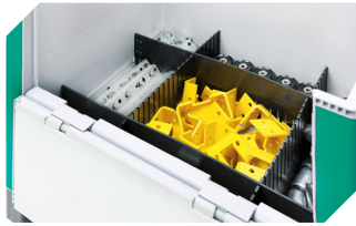
Stecksystem-Unterteiler längs L 724 x B 5 x H 180 mm 52-30385