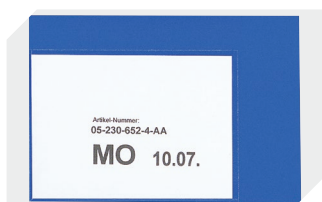
Pochettes porte-documents fixation auto-adhésive 2 côtés ouverts l 145 x l 100 mm 46-21108