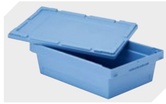
Stülpedeckel für Mehrwegbehälter MB L 400 x B 300 mm 6-30277