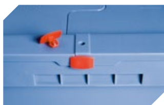
Plomben MBP2 - für BITOBOX MB 6-15705