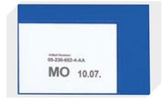
Etikettentaschen selbstklebend 2 Seiten offen L 145 x B 100 mm 46-21108