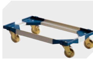
Transportroller für Mehrwegbehälter 800 x 400 mm und 800 x 600 mm L 720 x B 540 mm 6-19439