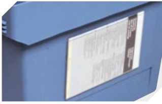
Etikettentaschen selbstklebend 3 Seiten offen L 175 x B 105 mm 6-5031