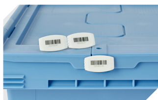
Plombage à codes à barres MBP3 - pour la BITOBOX MB toutes dimensions et pour bacs XL 800 x 600 mm 6-31550