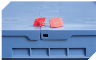
Scellés de sécurité MBP2-L - pour la BITOBOX MB, XL, SL 6-19162