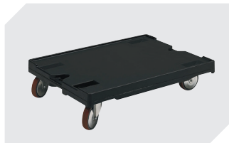
Plateaux roulants pour bacs 800 x 600 mm 1 800 x 1 600 x H 198 mm 43-1150