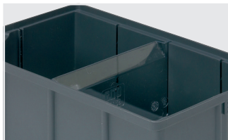
Séparateurs transversaux pour bacs de compartimentage, série EK l 170.2 x p 13 x H 80.5 mm 9-16502