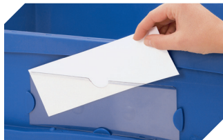
Etiketten für BITOBOX XL und KLT mit einer Mindesthöhe von 170 mm B 210 x H 74 mm 43-14557