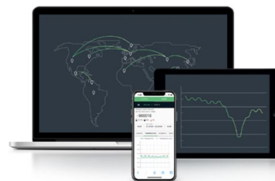
PC Software BITO Shipment Tracking Cloud für Windows 7 und neuer zur Aktivierung, Steuerung oder Auswertung von Datenanalysen.