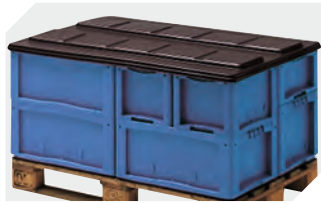
Palettenabdeckhauben L 1220 x B 820 mm 9-18421