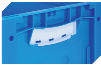
Obturateurs pour poignées ouvertes pour bacs gerbables norme Europe, série XL d'une hauteur de 170, 220 et 270 mm 43-31450