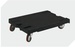
Transportroller für Behälter 800 x 600 mm L 800 x B 600 mm 43-1150