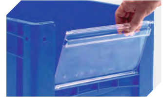
Sichtscheiben für Eurostapelbehälter XL B 460 x H 198 mm 43-22548