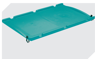
Couvercles indépendants peut être monté sur charnières d'un côté, convient aux bacs pour petit matériel, série KLT, et bacs gerbables norme Europe, série XL l 600 x l 400 mm 43-21523