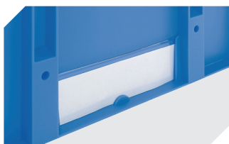
Protège-étiquettes pour bacs gerbables norme Europe, série XL et pour bacs pour petit matériel, série KLT l 209 x H 67 mm 9-20053