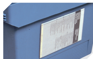
Pochettes porte-documents fixation auto-adhésive 3 côtés ouverts l 175 x l 105 mm 6-5031