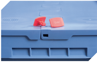
Plomben MBP2-L - für BITOBOX MB, XL, SL 6-19162