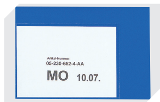
Pochettes porte-documents fixation auto-adhésive 2 côtés ouverts l 145 x l 100 mm 46-21108