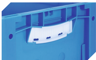
Obturateurs pour poignées ouvertes pour bacs gerbables norme Europe, série XL d'une hauteur de 170, 220 et 270 mm 43-31450