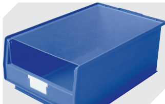
Couvercles anti-poussière pour bacs à bec, série PK l 450 x l 300 x H 2 mm 2-1124