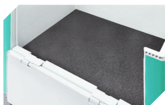
Revêtement de fond anti-dérapant pour bacs pour charges lourdes, série SL 1 720 x 1 520 x H 8 mm 52-30380