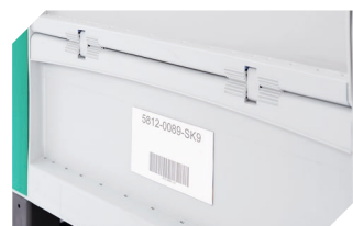
Porte-étiquettes 1 240 x H 80 mm 52-30386