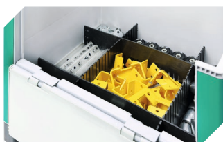
Séparateurs emboîtables à découper en largeur 1 524 x 15 x H 180 mm 52-30384