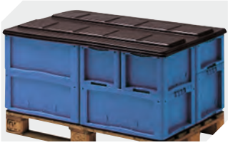
Palettenabdeckhauben L 1220 x B 820 mm 9-18421