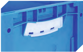
Griffverschlüsse für Eurostapelbehälter XL Höhen 320 und 420 mm 43-31448