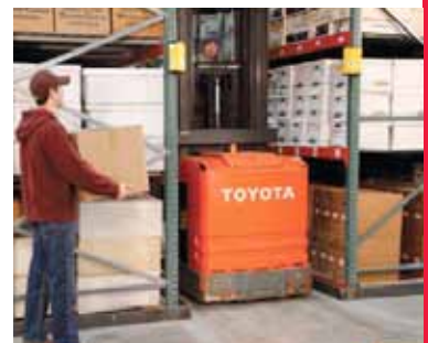
Collision Sentry verfügt über Bewegungsmelder mit Infrarot-Technologie, die in uneinsehbare Bereiche (bzw. tote Winkel) „hineinsehen“.

BITO-Lagertechnik Bittmann GmbH Obertor 29 D-55590 Meisenheim