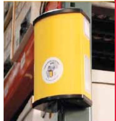
Leicht zu installieren, batteriebetrieben, kompakt und sehr gut sichtbar.