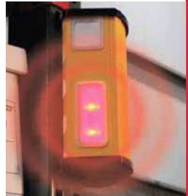
Sehr gut sichtbare LED-Lampen: Blinken zur Warnung auf, wenn Bewegung auf beiden Seiten festgestellt wird.