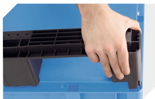
Kit de semelles pour bacs gerbables norme Europe, série XL 43-20273