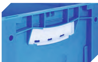
Griffverschlüsse für Eurostapelbehälter XL Höhen 170, 220 und 270 mm 43-31450