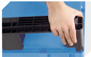
Kufensets für Eurostapelbehälter XL 43-20273