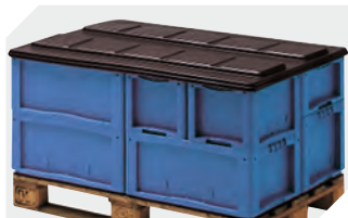
Palettenabdeckhauben L 1220 x B 820 mm 9-18421