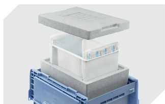
Sets d'isolation thermique pour bacs de distribution, série MB 6-31363