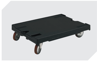
Transportroller für Behälter 800 x 600 mm L 800 x B 600 x H 198 mm 43-1150