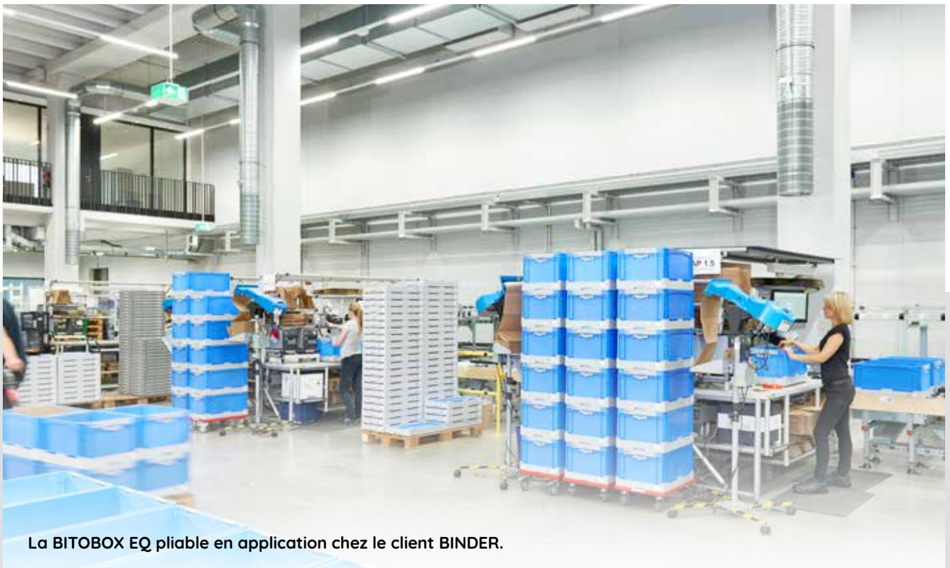
La BITOBOX EQ pliable en application chez le client BINDER.

Si vous avez besoin d'un bac pliable peu encombrant et polyvalent, qui peut même être utilisé dans des entrepôts automatisés, parlez-en dès maintenant à l'un de nos experts du stockage et de la manutention des matériaux.