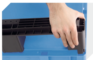
Kit de semelles pour bacs gerbables norme Europe, série XL 43-20273