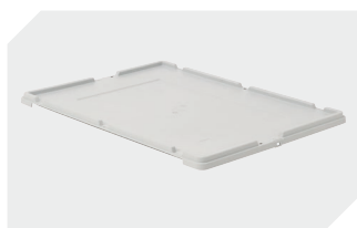
Couvercle coiffant pour bacs gerbables norme Europe, série XL l 800 x l 600 mm 43-14853