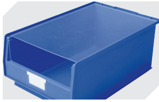
Couvercles anti-poussière pour bacs à bec, série PK l 450 x l 300 x H 2 mm 2-1124