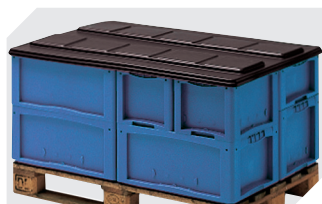
Coiffes pour conteneurs palettisés