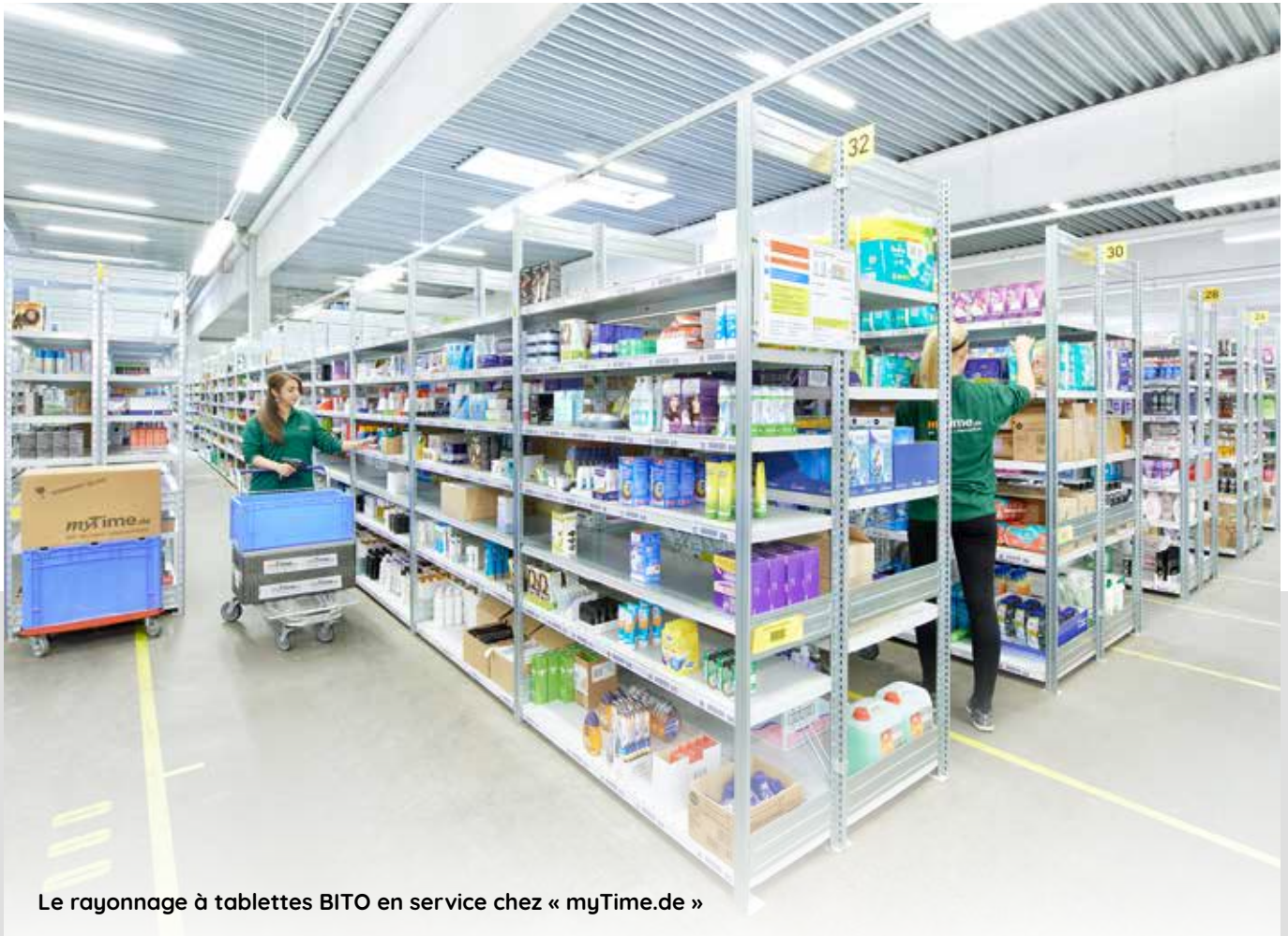
Le rayonnage à tablettes BITO en service chez « myTime.de »

Polyvalents, flexibles et de qualité supérieure, les rayonnages à tablettes BITO conviennent au stockage d'un grand nombre d'articles différents. Ils s'adaptent de manière optimale en hauteur et en longueur à chaque espace, sont faciles à monter et à adapter et ils peuvent être élargis ultérieurement selon besoin. Ils sont idéaux pour le stockage et la préparation de commandes de charges unitaires ainsi que d'articles en suremballage ou en vrac.