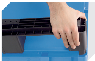
Kit de semelles pour bacs gerbables norme Europe, série XL 43-20273