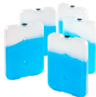
Acumuladores de frío rígidos PCM