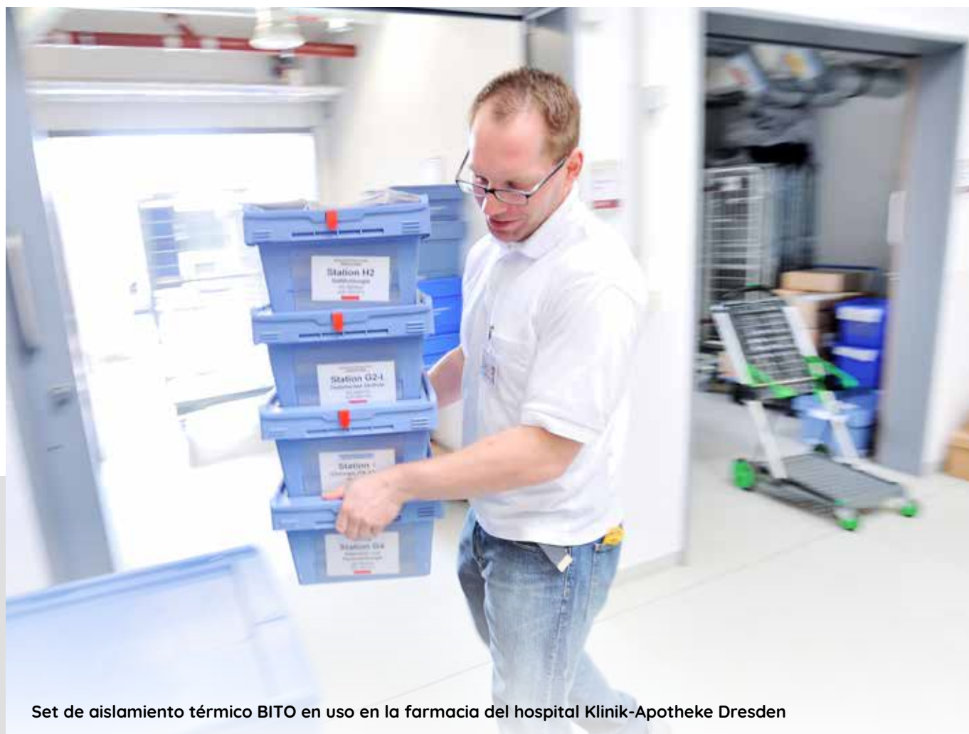
Set de aislamiento térmico BITO en uso en la farmacia del hospital Klinik-Apotheke Dresden

El conjunto de aislamiento térmico BITO encaja perfectamente en las cajas multiusos BITO MB y permite transportar medicamentos y vacunas de forma segura. Con el set se garantiza una temperatura interior de 2 a 8°C durante al menos 15 horas. Combina una cubeta interior de poliestireno resistente a los impactos, un inserto isotérmico interior de Neopor® y tres acumuladores de frío ICECATCH® Solid Insulated.