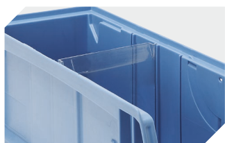
Séparateurs transversaux CQT pour bacs CTB - mm 53-31303