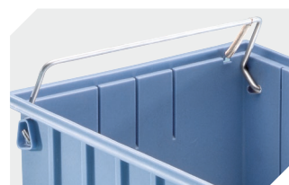
Poignée de sécurité (non compati- ble avec les couvercles anti- poussière) pour bacs de rangement RK et bacs CTB 3-31314