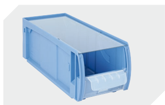
Couvercles anti-poussière CSD pour bacs CTB l 369 x l 148 mm 53-31342