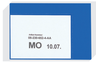
Etikettentaschen selbstklebend 2 Seiten offen L 145 x B 100 mm 46-21108