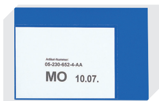
Pochettes porte-documents fixation auto-adhésive 2 côtés ouverts l 145 x l 100 mm 46-21108