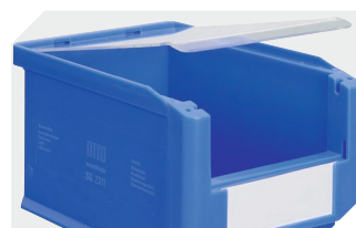
Couvercles anti-poussière pour bacs à bec, série SK l 482 x l 299 x H 2.5 mm 2-1136