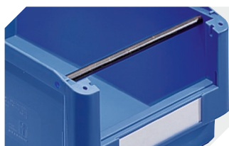
Barres de manutention pour bacs à bec, série SK l 281 mm 2-19527