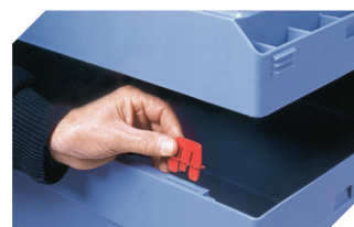
Clips de fermeture 6-15625