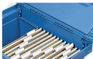
Rails pour dossiers suspendus pour bacs de distribution, série MB 6-11920