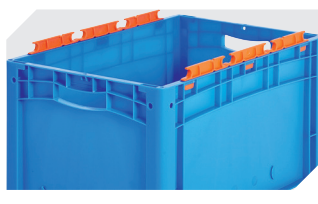
Côtés avec encoches porte-sacs peut être démonté 6-31553