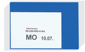
Etikettentaschen selbstklebend 2 Seiten offen L 145 x B 100 mm 46-21108