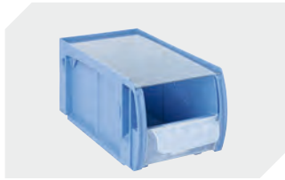
Staubdeckel CSD für C-Teile-Behälter CTB L 269 x B 148 mm 53-31341