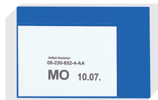
Etikettentaschen selbstklebend 2 Seiten offen L 145 x B 100 mm 46-21108