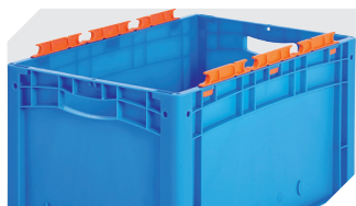
Grands côtés avec encoches pour sacs peut être démonté 6-31553