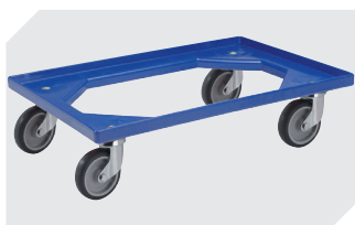
Plateaux roulants matériel des roues : caoutchouc l 620 x l 420 mm 43-21883