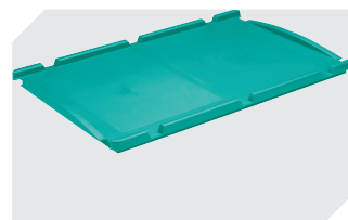
Couvercles indépendants pour bacs pour petit matériel, série KLT l 600 x l 400 mm 43-20497