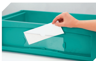
Protège-étiquettes pour bacs pour petit matériel, série KLT pour bacs gerbables norme Europe, série XL fixation solide l 218 x H 80 mm 9-20054