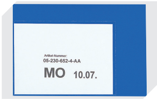
Etikettentaschen selbstklebend 2 Seiten offen L 145 x B 100 mm 46-21108