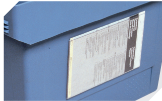
Etikettentaschen selbstklebend 3 Seiten offen L 175 x B 105 mm 6-5031