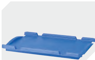
Auflagedeckel für Eurostapelbehälter XL L 300 x B 200 mm 43-30392