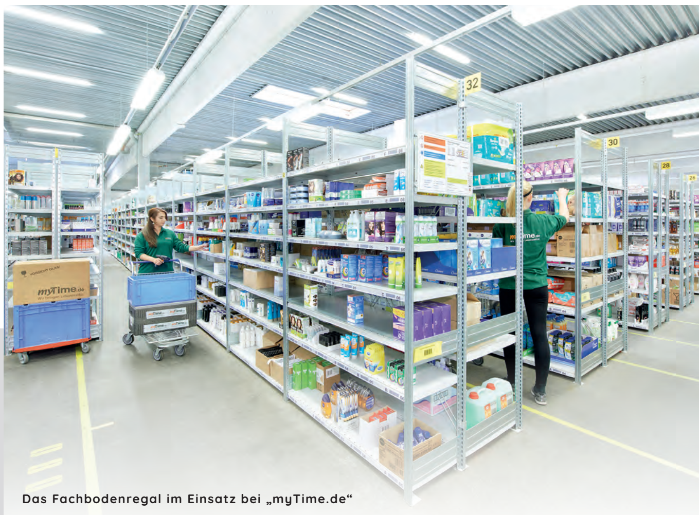
Das Fachbodenregal im Einsatz bei „myTime.de“

Die BITO Fachbodenregal-Anlagen sind hochwertig in der Ausführung und eignen sich für die Lagerung aller vorstellbaren Artikel. Sie lassen sich in Höhe und Länge optimal an jeden Raum anpassen, sind leicht zu montieren bzw. umzubauen, problemlos auch im Nachhinein zu ergänzen und ideal für die Lagerung und Kommissionierung loser Artikel und nicht palettierter Einheiten und Umverpackungen.